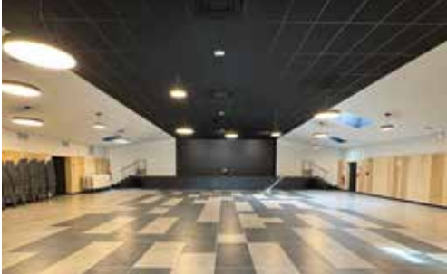
La salle MPT rénovée