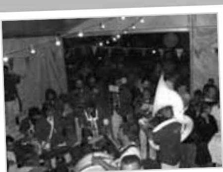
Pendant les fêtes: une ambiance béarnaise grâce à l'excellente banda "Los compañeros".