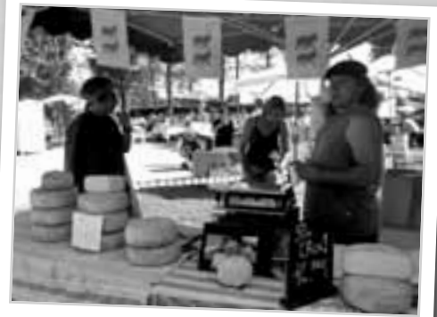
Les stands du marché artisanal de septembre.

Le marché Artisanal et le vide grenier du mois de Septembre. Devant le succès de cette première manifestation de rentrée, nous comptons reconduire cette opération vers mi-septembre 2009 avec beaucoup plus d'artisans et de producteurs.