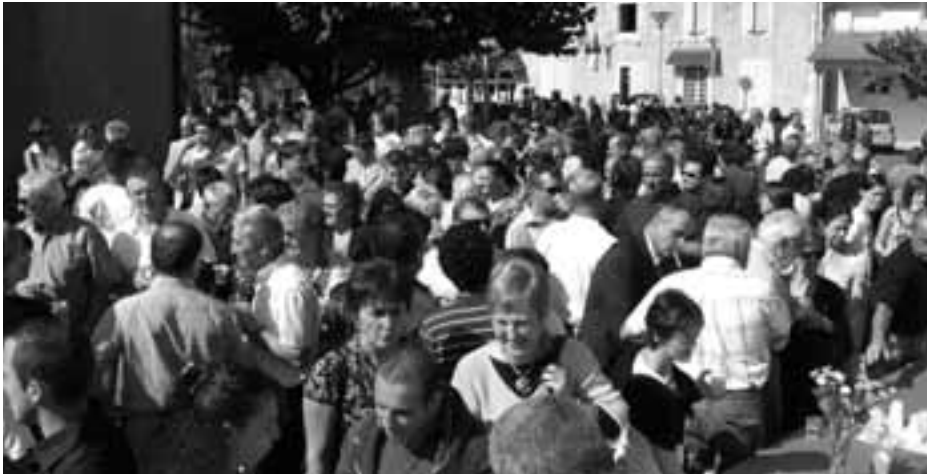
Une nombreuse assistance.