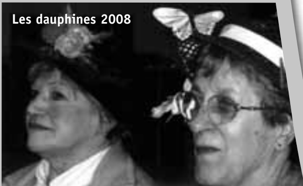
Les dauphines 2008

Nous avons organisé le repas de la sainte Catherine dimanche 23 novembre à midi à la Maison Pour Tous.