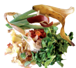
Épluchures, fruits & légumes gâtés