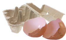
Coquilles & boîtes d'œufs (écrasées et en morceaux)