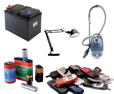
Piles, petits objets ménagers électriques ou électroniques