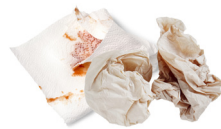
Serviettes, essuie-tout & mouchoirs (en morceaux)