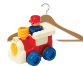
Les petits objets cassés